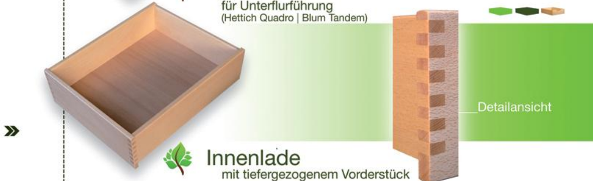
Innenlade mit tiefergezogenem Vorderstück