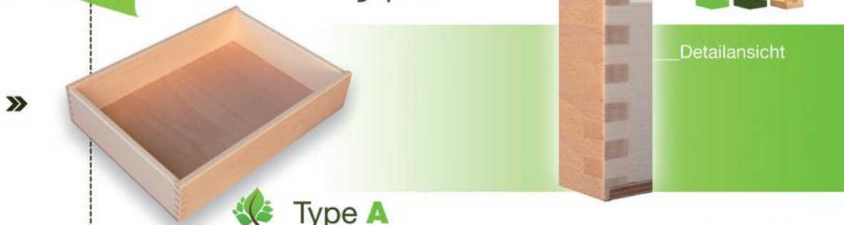
Type A für Rollschubführung